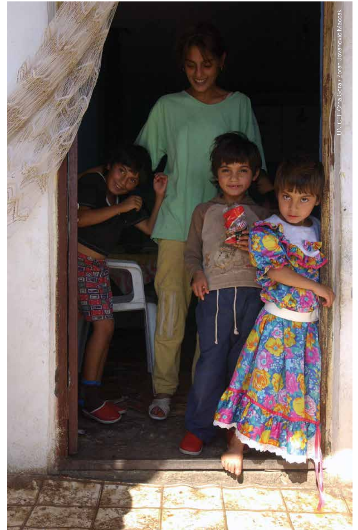
UNICEF Crna Gora / Zoran Jovanović Maccak